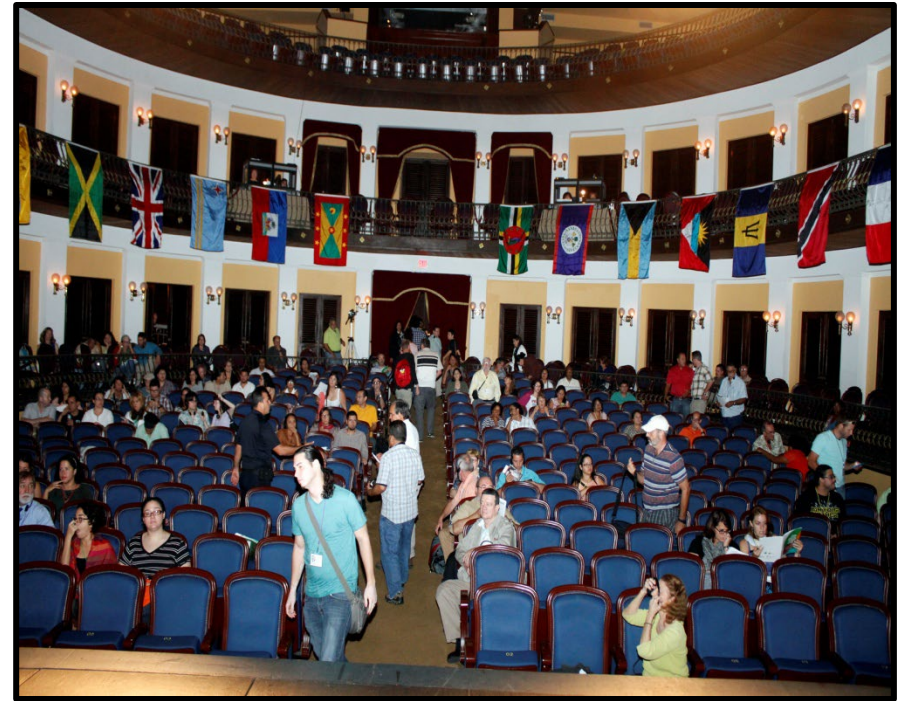
Teatro Tapia, Sede del Congreso